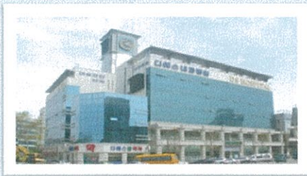
DS 내과병원 전경